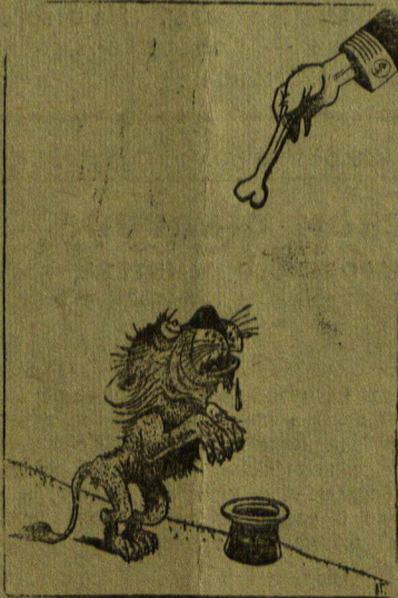
Се — лев (британский)

Прогрессивная английская общественность указывает, что продолжение нынешней политики еще более усугубит экономические затруднения Англии. Английский народ требует